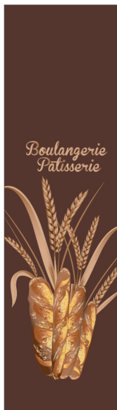
Maquette « nettoyée ».