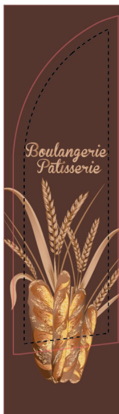
Gabarit + Maquette client